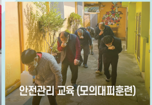
안전관리 교육 (모의대피훈련)