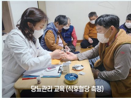
당뇨관리 교육 (식후혈당 측정)