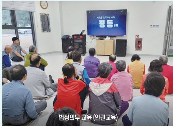
법정업무 교육 (인권교육)

국가인권위원회 사이버 인권교육 영상을 활용하여 인권 공부 첫걸음 - 평등/연대를 시청했어요.